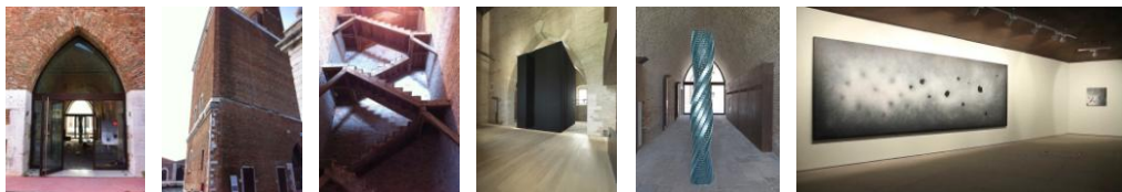
Immagini del Padiglione “Torre di Porta Nuova”, Arsenale Nord Bacini, e relative all’installazione “Breath” di Shirazeh Houshiary. Art Biennale 2013