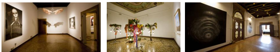
Immagini del Padiglione “Spazio Espositivo Light-Box”, Strada Nuova Venezia, relative all’installazione Coreana “Who is Alice?” Art Biennale 2013

Attualmente, altri nostri importanti clienti sono: lo Studio di commercialisti “Multistudio PBA” in via Cappuccina a Venezia Mestre e la Società di servizi informatici “Easy Soft / Easy Pc”, presso la loro nuova sede di Torre Eva , via Maderna 7, Mestre Venezia.