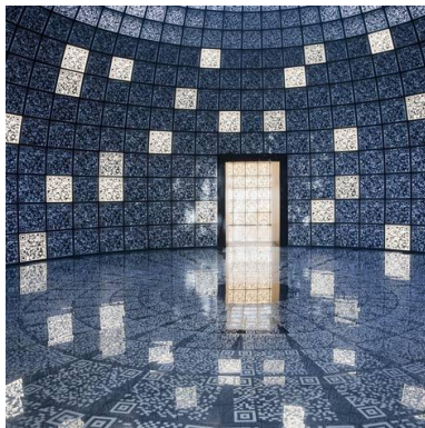
Il padiglione “Russia”, Biennale Architettura 2012

Negli anni, il fatturato di Isola è gradualmente cresciuto anche grazie ai servizi di alta qualità che la cooperativa garantisce e alla notorietà progressivamente acquisita in seguito a contratti importanti come ad esempio il servizio di pulizie reso nel Padiglione “ Russia ” della Mostra Internazionale di Architettura “ Common Ground ”, Venezia, 26 Agosto – 24 Novembre 2012. In quel caso, il nostro diretto committente è stato il famoso studio di architettura “ SPEECH Tchoban&Kuznetsov ” di Mosca, che ha curato l’intera installazione d’architettura, ed ha ricevuto una menzione speciale della Giuria per l’innovazione e la cura del dettaglio. Nella 55. Mostra Internazionale d’arte biennale a Venezia, “ Il Palazzo Enciclopedico ”, Venezia 1 Giugno 2013 – 24 Novembre 2013, Isola online ha ricevuto la committenza per Servizi di pulizie in 3 delicati eventi collaterali d’arte: